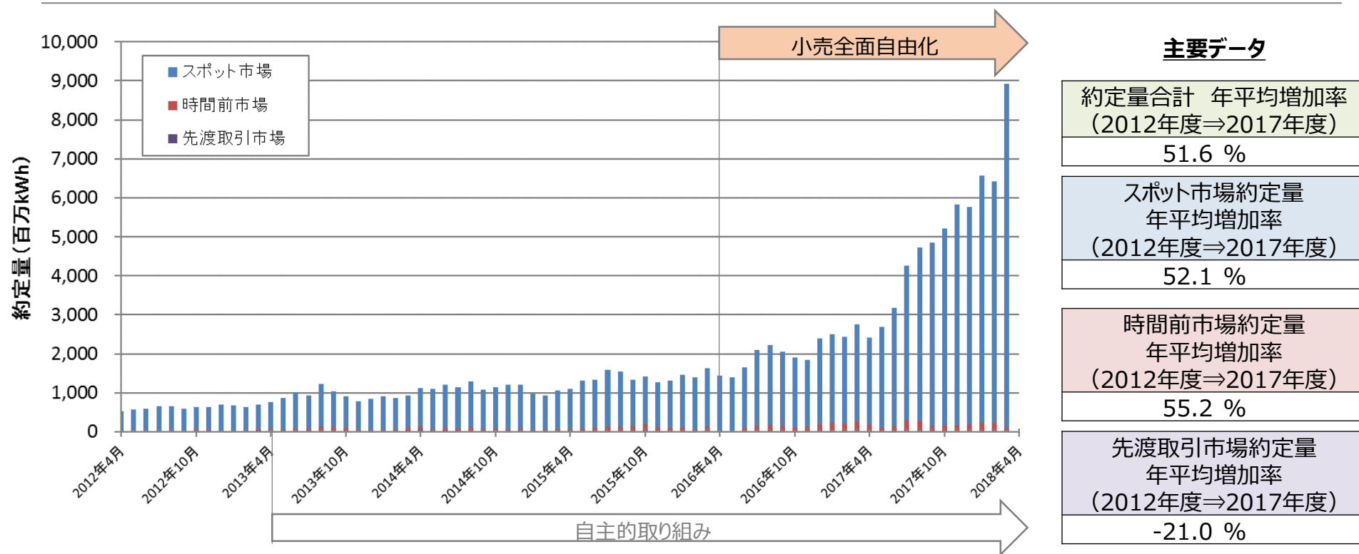
JEPX約定量の推移（2012年4月～2018年3月）